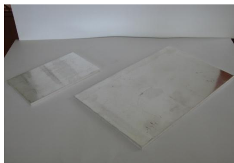
Сребърни аноди (пр.999,9)