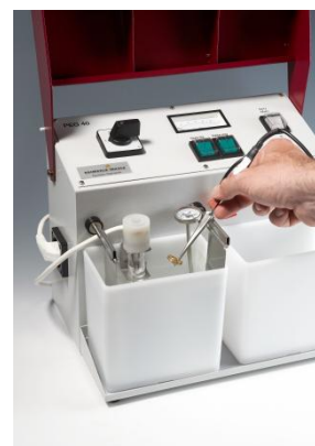
Установка за електрополиране PEG 40 1,5 L – 2 бр. вани