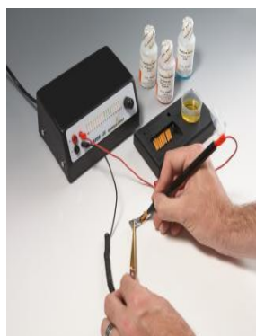
Установка за селективно родирание с писалка