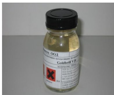
Ратвор за позлатяване с писалка