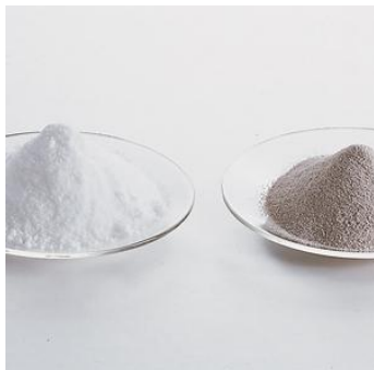
Благородни соли за паладиране позлатяване и посребряване