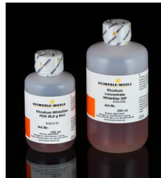
Електролити за родирание с писалка и във вана